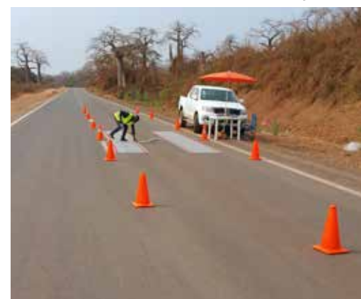
Pré-sélection avec un système WIM à faible vitesse en Angola