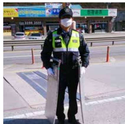
Policier portant 2 pèses roues en Corée du Sud