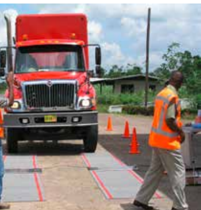
au Surinam avec des pèses roues es