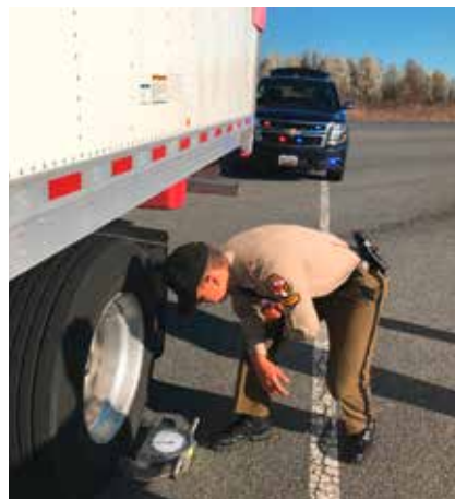
Le pèse roues mécanique WL 101 est largement utilisé aux États-Unis pour le contrôle officiel du poids

Depuis 1974, nous fabriquons des pèses roues mobiles pour déterminer le poids des véhicules lourds. Nous distribuons nos pèses roues dans le monde entier grâce à nos filiales ou des représentations locales qualifiées.