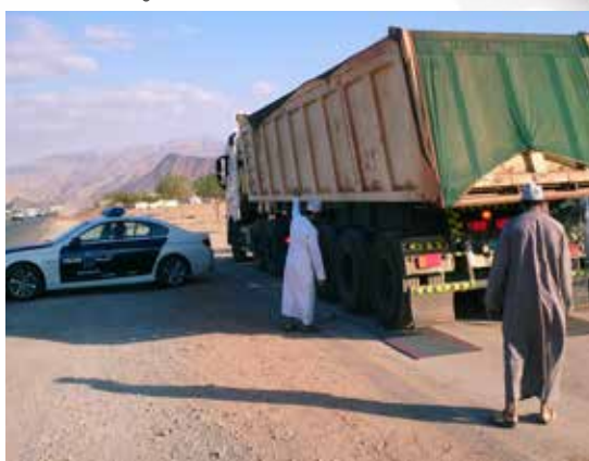
Contrôle de poids lourds à Oman