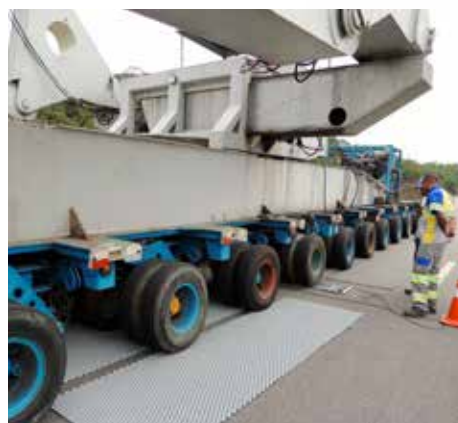
Contrôle de poids des véhicules surdimensionnés au Brésil