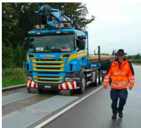
Pré-sélection avec le WL 104 en Suisse